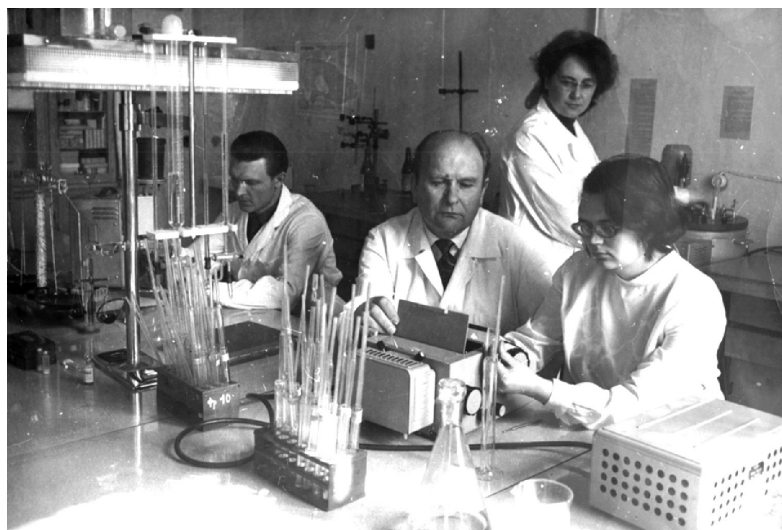
З учнями під час наукових досліджень, 1973 рік