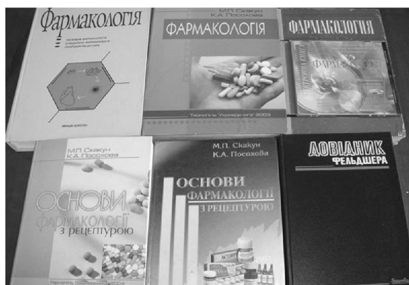
Підручники з фармакології авторства М. П. Скакуна

Невтомний дослідник, який постійно торив нові шляхи в науці, М. П. Скакун ініціював глибоке вивчення гепатотоксичності лікарських засобів і отрут, їхню ембріотоксичну та тератогенну дію, зокрема