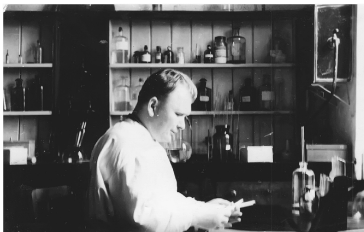
У лабораторії, 1950 рік