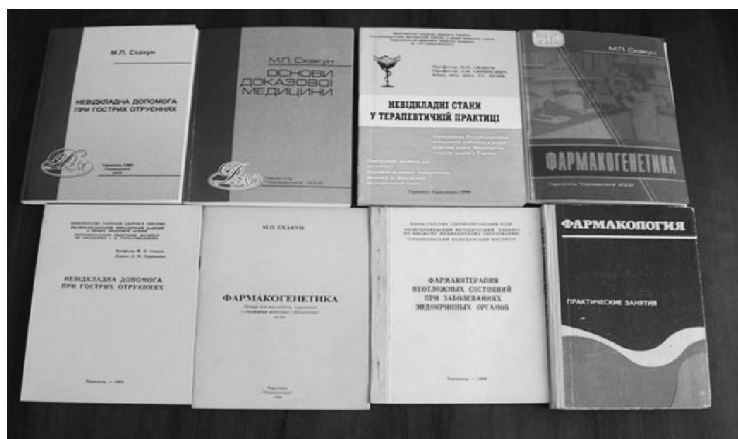
Навчальні посібники авторства М. П. Скакуна